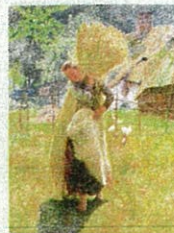
エミール・ウスマス (何原平三) 1895年 油彩・キャンバス 個人蔵

19世紀末から20世紀初頭にかけて、ベルギー北部のフランクス地方にある村「セント・マルテンス・ラーテム」には、芸術家に移り住み、質の高い豊かな創作活動が展開されました。今回は芸術家たちが制作した89点の作品を、時代を遡って象徴主義、印象主義、表現主義の3つの世代に分けて紹介。 (2010年9月4日～10月24日 Bunkamura サ・ミュージアムにて開催)